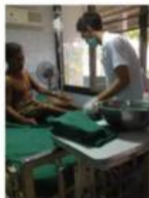
ขั้นที่ 2 เสนอสถานการณ์ที่ต้องการแก้ไข้ปัญหาโดยการเล่าเรื่อง