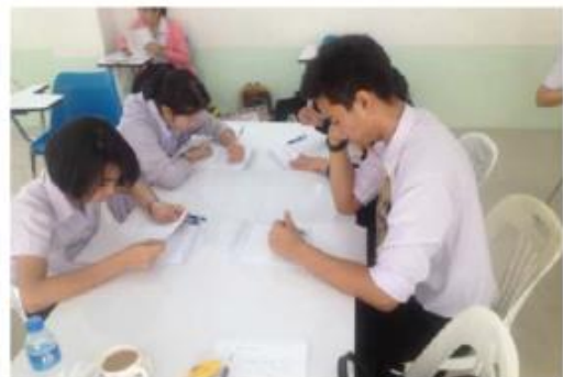
การประเมินผล

บทสรุประยะที่ 2 การพัฒนารูปแบบการสอนในคลินิกที่ส่งเสริมทักษะการคิดอย่างมีวิจารณญาณมุ่งเน้นการจัดการเรียนการสอน 3 ด้าน คือ