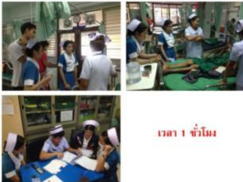
ขั้นที่ 5 ฝึกคิดร่วมกันแบบเป็นกลุ่ม