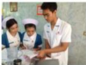
เวลา 2 ชั่วโมง