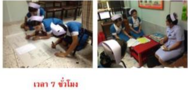
ขั้นที่ 4 สร้างองค์ความรู้ใหม่