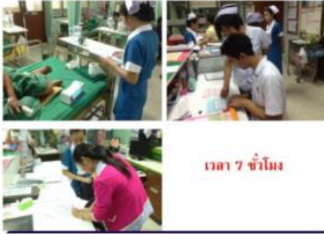
ขั้นที่ 3 สร้างความขัดแย้งทางปัญญา