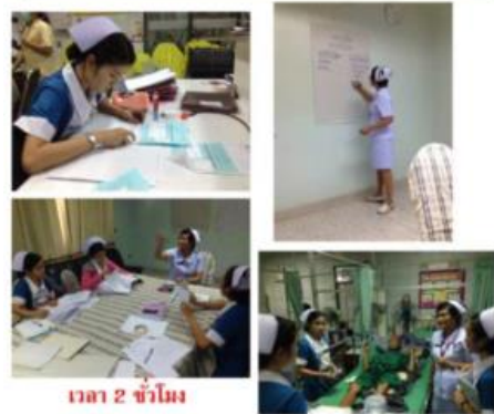
ขั้นที่ 6 ต่อยอดความรู้