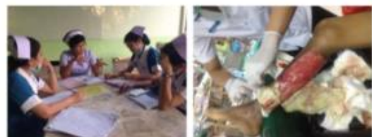
เวลา 5 ชั่วโมง